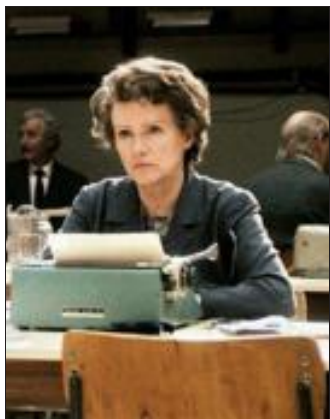
Hannah Arendt se retrouve isolée quand elle publie ses articles sur la théorie de la banalité du mal.

En 1961, la philosophe juive allemande Hannah Arendt est envoyée à Jérusalem par le New Yorker pour couvrir le procès d'Adolf Eichmann, responsable de la déportation de millions de Juifs. Les articles qu'elle publie et sa théorie de "La banalité du mal" déclenchent une controverse sans précédent. Son obstination et l'exigence de sa pensée se heurtent à l'incompréhension de ses proches et provoquent son isolement.